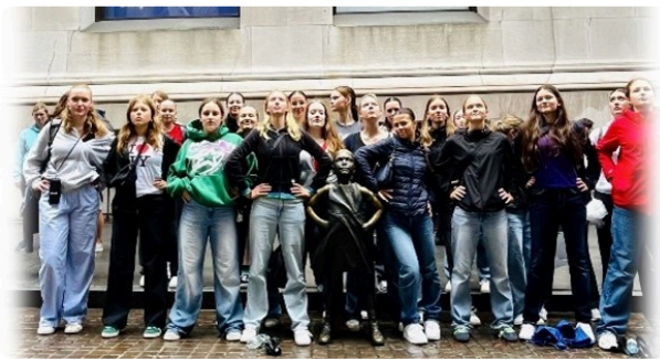
Experiment goes New York City! Bist Du dabei?