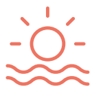
Höchste Sonnenscheindauer in Neuseeland