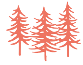
New Forest National Park