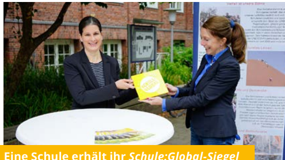
Eine Schule erhält ihr Schule:Global -Siegel