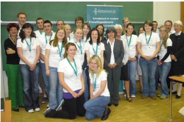
Gemeinsam im Einsatz für die Gesundheit: Teilnehmer aus Irland und Deutschland sowie Vertreter des Gesundheitsamts, der Stadt, der Universitätsklinik Bonn und natürlich von Experiment e.V.