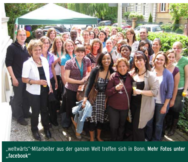
„weltwärts“-Mitarbeiter aus der ganzen Welt treffen sich in Bonn. Mehr Fotos unter „facebook“

Trotz aller Unterschiede - das gemeinsame Ziel bleibt: 'weltwärts' ist ein wichtiger internationaler Beitrag zu Verständigung, Achtung und Toleranz. Das Programm bereitet auf die sensiblen globalen Zusammenhänge vor, von denen letztlich wir alle abhängig sind.