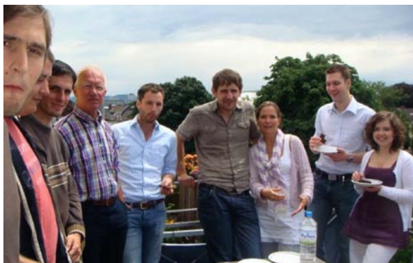
Gut gelaunt bei „Wasser und Brot“: Erstmals seit seiner Wahl im April tagen der neue Vorstand und Beirat in der Bonner Bundesgeschäftsstelle

Liebe Mitglieder, hiermit möchte ich Ihnen kurz über das erste gemeinsame Treffen des neu gewählten Vorstands berichten, das am 20.06.2009 in der Geschäftsstelle in Bonn stattfand. Die Sitzung diente in erster Linie dem gegenseitigen Kennenlernen, einer generellen Bestandsaufnahme sowie der aktiven Aufnahme der Vorstandsarbeit durch erste Entscheidungen. Gleichzeitig tagte in der Geschäftsstelle der Beirat, mit dem wir uns in zwei produktiven Sitzungen besprechen konnten.