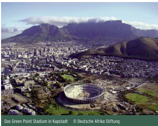
Das Green Point Stadium in Kapstadt

„Ke Nako - Es ist Zeit“ ist das Motto der künftigen Fußballweltmeisterschaft in Südafrika 2010. Die Förderung in Höhe von 6.980 Euro für einen einjährigen Schulbesuch auf einer südafrikanischen High School richtet sich an besonders motivierte Jugendliche, die ihre finanzielle Förderwürdigkeit formlos nachweisen.